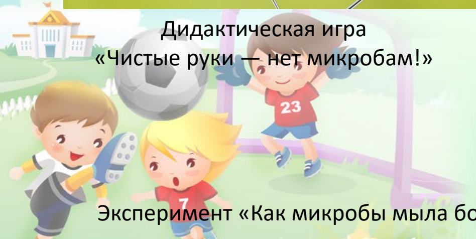
Эксперимент «Как микробы мыла боятся»